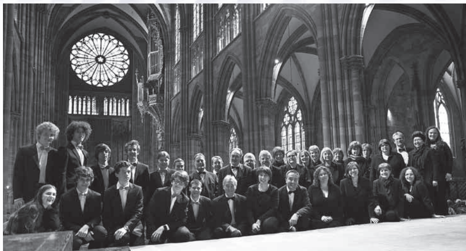
Chœur de Chambre du Conservatoire de Musique de la Ville de Luxembourg